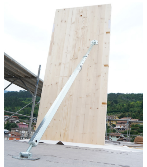
^ GIRAFFE MONTAGESTÜTZE

Und schließlich haben wir nun ein Sortiment neuer, spezifischer Montageschablonen für unsere gängigsten Befestigungen, darunter Schablonen für die präzise 45°-Montage unserer Schrauben als auch Schablonen zur Montage und Befestigung der legendären Balkenträger ALU wie auch anderer Lösungen. Mit unserem neuen Katalog bieten wir das notwendige Minimum, damit bei jeglicher Arbeit im Holzbau das Maximum erzielt werden kann“, versichert Dal Ri abschließend.