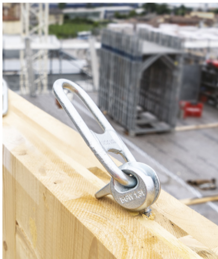
^ WASP TRANSPORTANKER FÜR HOLZELEMENTE

Maschinen und Werkzeuge, und stolz fügt er hinzu: Mit diesem Katalog haben wir riesige Schritte in diese Richtung gemacht. Sehen Sie, Rothoblaas ist in der Holzbaubranche für seine regelmäßigen Markteinführungen von Innovationen bekannt. Auf diese Weise möchten wir ein für alle Mal klarstellen, dass das Unternehmen auch die besten Werkzeuge liefert, um diese Innovationen beim Bau einsetzen zu können.“