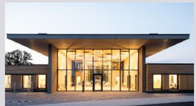
Kindertagesstätten (SWISS KRONO | Foto: Jan Meier)