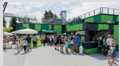
Restaurants (SWISS KRONO)