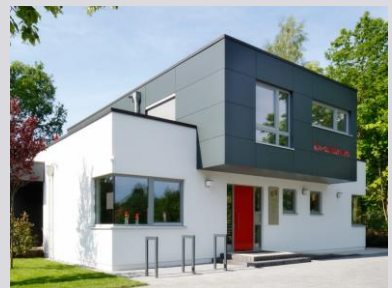
Arztpraxen (MAX-Haus GmbH | Foto: Daniel Wetzel)