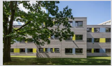
Verwaltungsgebäude (ERNE AG Holzbau)