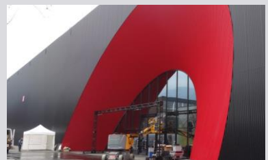
Messehallen (Messe Dornbirn GmbH)