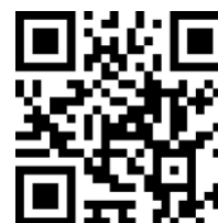
QR-Code Bad Grund