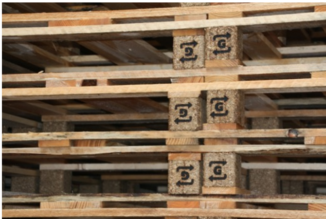
Die GUTEX Retour-Paletten sind gekennzeichnet mit einem G, das oben und unten von zwei Kreislaufpfeilen eingerahmt ist.

Hersteller und die in der Lieferkette nachfolgenden Handelspartner sind nach dem Verpackungsgesetz für die Rücknahme bzw. Entsorgung von Verpackungen und somit auch von Paletten verantwortlich. Mit dem neuen Paletten-Retour-System erfüllt GUTEX die eigene Verpflichtung und übernimmt diese zusätzlich auch für die Kunden. Gleichzeitig werden dem im Verpackungsgesetz befürworteten vorrangigen Wiedereinsatz von Verpackungen vor deren Entsorgung Rechnung getragen und Kosten für die Beseitigung eingespart.