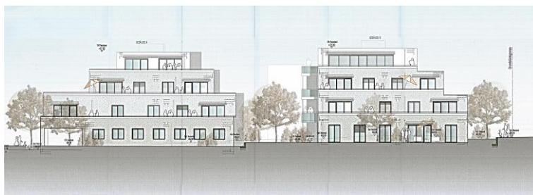
ANSICHT SÜD BEIDE GEBÄUDE

Ein natürliches Raumklima, eine gute Energieeffizienz und der Einsatz nachhaltiger Baumaterialien waren dem Bauherrn ein Anliegen. Beide Objekte sind als KfW-Effizienzhaus 40 ausgeführt. Kubische Architektur mit Flachdach, bodentiefe Fenster und eine gehobene Ausstattung machen die Gebäude nicht nur von außen zum Blickfang, sondern auch neugierig auf die Gestaltung der Räumlichkeiten. Die Wohnungen überzeugen durch variantenreiche Grundrisse mit durchdachter Raumaufteilung.