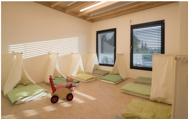
SWISS KRONO OSB/3 sensitiv für sensible Bereiche wie Schlafräume in Kindergärten

Ausgestattet mit einer ContiFinish®-Oberfläche überzeugt die Platte nicht nur im Innenbereich, sondern auch bei der Verwendung in feuchten und nicht bewitterten Bereichen.