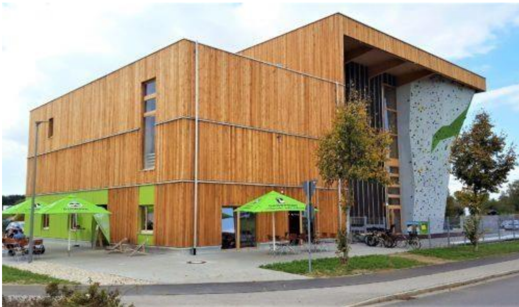
Das neue DAV Kletterzentrum in Neumarkt bietet seinen Besuchern Kletterspaß auf insgesamt 600 m 2 .

Der Deutsche Alpen Verein (DAV) Neumarkt mit rund 5.100 Mitgliedern liebt die Berge und schützt die Natur. Deshalb wurde bei der Auswahl des Materials für die neue Kletterhalle des DAV in Neumarkt auch ganz besonders auf eine umweltschonende Produktion sowie die gesundheitliche Qualität geachtet.