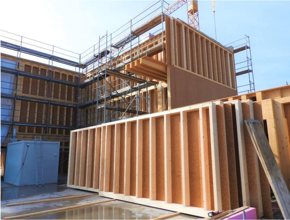
Die von Pfleiderer gestifteten LivingBoard face Platten bei der Montage während des Baus der Kletterhalle.