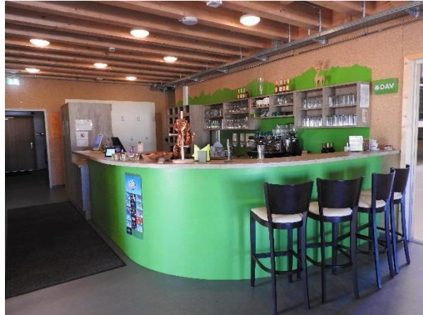
Auch beim Innenausbau kamen Holzwerkstoffe von Pfeiderer zum Einsatz und schaffen ein einladendes Ambiente.