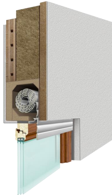
Einbausituation: PRIX Einbaukasten aus der Öko-Line im Holzhaus