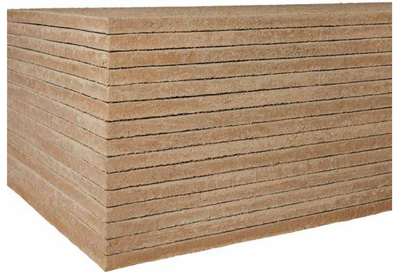
BU: Lehmplatten gibt es in verschiedenen Stärken im Rastermaß von 1.250 x 625 Millimeter und sind optimal für den Innenausbau geeignet.

Die Oberfläche der Agaton Lehmplatten werden mit einer nur fünf bis acht Millimeter starken Oberputzschicht versehen. Als vollflächige Armierung dient Glasseidengewebe. Zur Oberflächengestaltung stehen – neben den naturfarbenen Feinputzen mit Lehmfarbenaufbereitung – auch 16 attraktive Edelputze zur Verfügung. Sämtliche Putze-Farben können problemlos vermischt und so individuelle Farbnuancen kreiert werden. Durch die individuelle Kombination aus Farben und Verarbeitungstechniken kann eine effektvolle Oberflächenwirkung geschaffen werden.