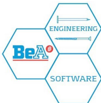
BeA Engineering Software-Logo.jpg

Die Joh. Friedrich Behrens AG ist mit den Marken BeA und KMR einer der europaweit marktführenden Hersteller von Befestigungstechnik für Holz und holzähnlichen Werkstoffen. Die seit über 100 Jahren bestehende Behrens-Gruppe vertreibt über einen weltweiten Verbund von Tochter- und Beteiligungsunternehmen in Deutschland entwickelte und produzierte Werkzeugmaschinen (druckluft- und gasbetriebene Nagel- und Klammergeräte) sowie entsprechende Befestigungsmittel (magazinierte Nägel, Klammern und Schrauben). Die Produkte zeichnen sich durch innovative Technologien, höchste Qualitätsstandards und moderne Fertigungsmethoden aus.