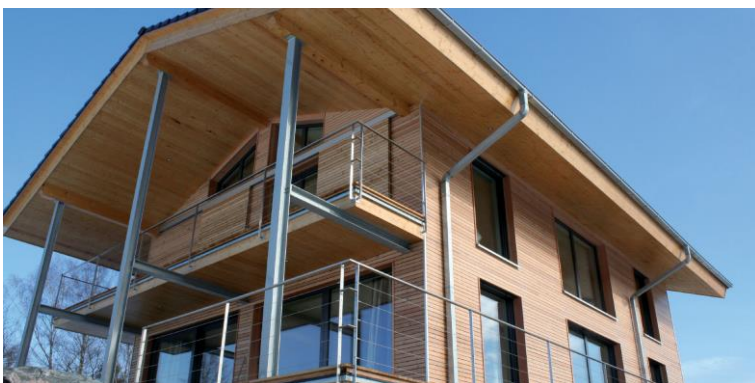
Fassade mit Holzfaserdämmung und Brettschalung

Bei der Außendämmung und der Gestaltung der Fassade ist SWISS KRONO MAGNUMBOARD® OSB sehr flexibel: Ob ein Wärmedämmverbundsystem oder Einblasdämmung, Mineralwolle oder Holzfaserdämmung, Putz oder Vorhangfassade mit Holztafelung – das Holzbau-system lässt viele Möglichkeiten zu.