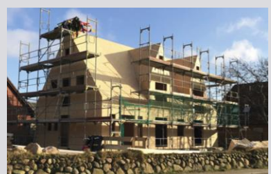
Gestaltungsfreiraum hinsichtlich Objektart, Grundrissen und Fassadengestaltung

Fotos: Balazs Komforthaus GmbH Rosengrün BEMA