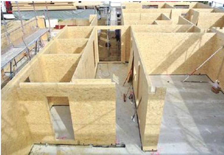
Raumaufteilung nach Wunsch und Bedarf mit SWISS KRONO MAGNUMBOARD® OSB

Die Raumaufteilung im Inneren der Gebäude kann ebenfalls ganz nach den Wünschen der Bauherren geschehen. Durch die schlanken Wände kann die Fläche bestens ausgenutzt werden. Ob große, offene Räume oder lieber mehrere kleinere – das liegt allein an den Anforderungen und Vorlieben der späteren Bewohner oder Nutzer. Damit ist jedes Haus aus SWISS KRONO MAGNUMBOARD® OSB ein Unikat.