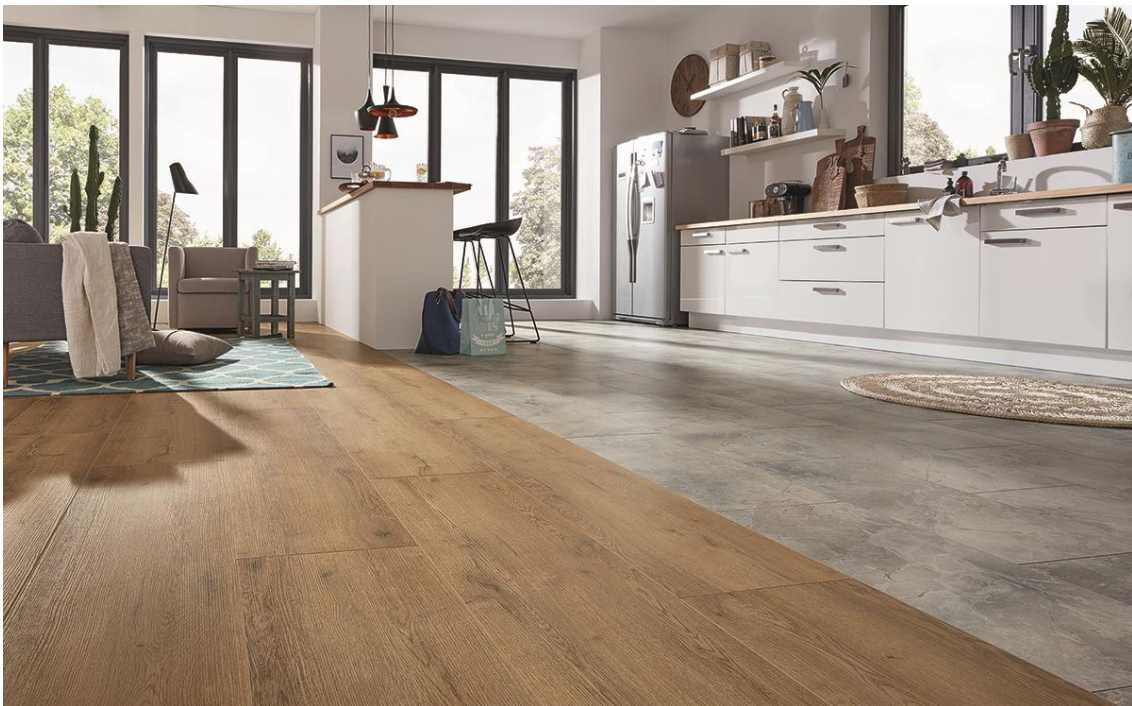
Aufbauten mit Trockenestrich erlauben verschiedene Bodendesigns

Damit stellen Deckenaufbauten mit Trockenestrich und SWISS KRONO OSB eine attraktive Alternative zum herkömmlichen Nassestrich dar – sowohl wirtschaftlich als auch hinsichtlich Schallschutz.