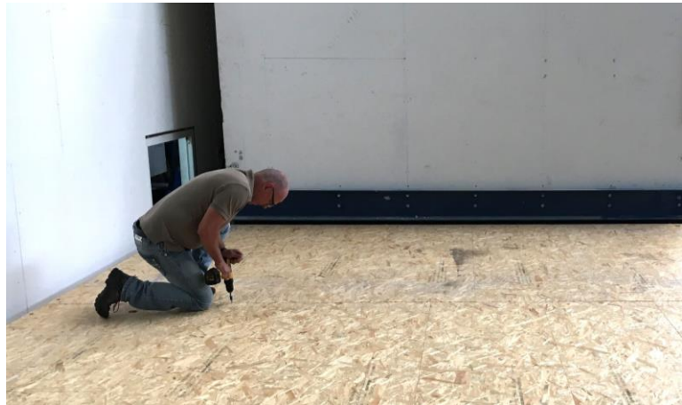
Holzbalkendecke mit Splittschüttung und SWISS KRONO OSB-Belplankung

Das Fazit gleich vorweg: Holzbalkendecken mit Trockenestrich-Aufbau können in wirtschaftlicher und schallschutztechnischer Hinsicht mit Nassestrich konkurrieren. Mit kluger Materialauswahl und -anordnung lassen sich ausgezeichnete Werte erzielen. Zum Beispiel: