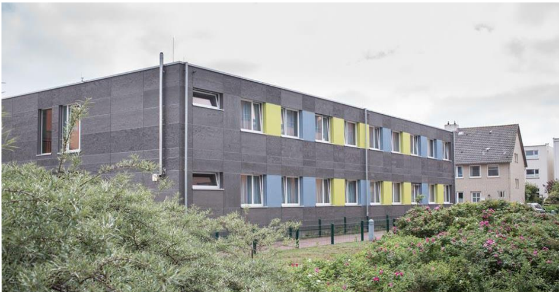
Temporäre Gebäude-Lösung: Eine Kombination aus Modul- und Elementbau

Die Reha-Klinik Norderney der Deutschen Rentenversicherung Westfalen im wunderschönen Ostfriesland – idyllisch und perfekt, direkt in der Brandungszone auf Norderney gelegen, erfüllt mit der reinen Seeluft und geringem Pollenflug beste Voraussetzungen für die Behandlung von Atemwegserkrankungen.