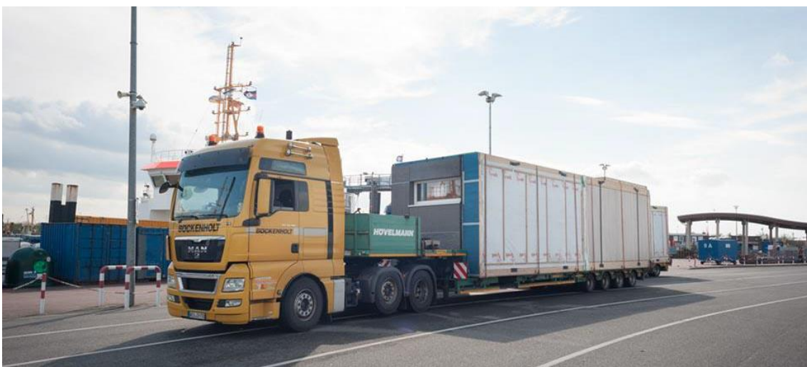
Eines von insgesamt 40 Modulen, das bereits 650 km von knapp 1.000 km zurückgelegt hat.

Die ERNE AG Holzbau garantiert kurze Bauzeiten, die aufgrund des hohen Vorfertigungsgrades problemlos einzuhalten sind. Die vorgefertigten Elemente bzw. Module aus SWISS KRONO OSB vereinen alle Vorteile des modernen Holzbaus – einer der Gründe, warum die ERNE AG Holzbau seit Jahren auf SWISS KRONO OSB setzt. So auch im Fall der Reha-Klinik Norderney: Insgesamt wurden bei den 40 Holz-Modulen auf über zwei Etagen ca. 3.030 m 2 SWISS KRONO OSB/4 BAZ , geschliffen sowie 1.050 m 2 SWISS KRONO OSB/3 EN 300 , stumpf verbaut. Doch wie kommen 40 Module aus der Schweiz auf die knapp 1.000 km entfernte ostfriesische Insel Norderney?