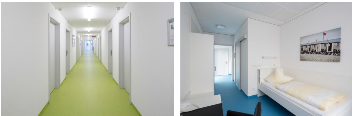
Der moderne Holzbau überzeugt durch klares Interieur in den Patientenzimmern

Gerade in sehr sensiblen Bereichen, wie in einem Klinik-Gebäude ist die Materialauswahl besonders wichtig. Ökologische Holzwerkstoffe unterstützen dabei das Nutzungskonzept ganzheitlich.