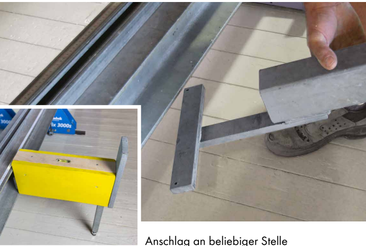
Anschlag an beliebiger Stelle