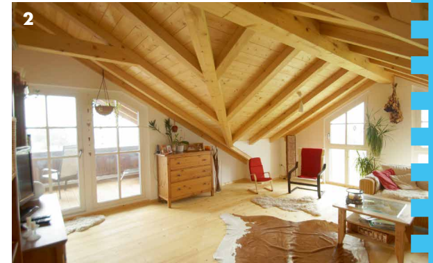
2 / Wohnhaus: Sichtdachstuhl mit Querbalken