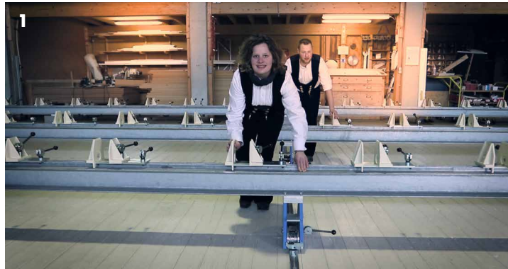
1 / Leichtgängigkeit der Bedienung

Eine Anmeldung ist erwünscht, aber auch Spontanbesucher sind herzlich willkommen!