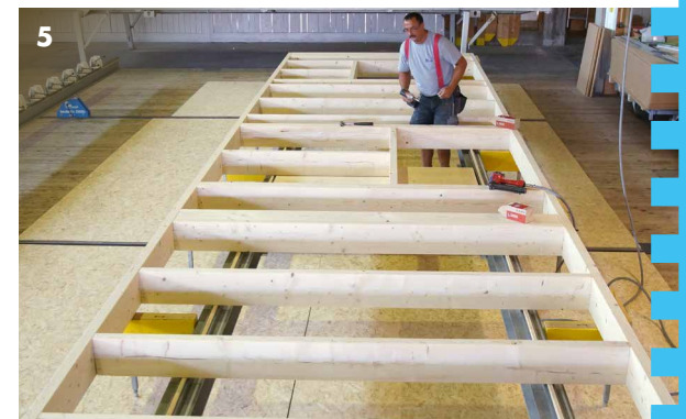
4 + 5 / Wandfertigung in idealer Arbeitshöhe: Auch beim Einlegen schwerer Ständer ergonomisch perfekt, da der „Tisch begehbar“ ist