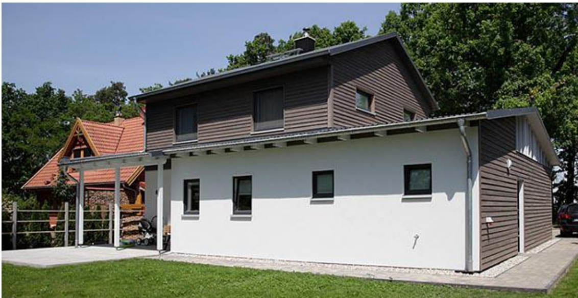
Kontrastreiche Fassade durch hellen Putz und dunkle Holzverkleidung

Für die Fassade entschieden sich die Bauherren für einen Mix aus Putz und Holz. Das Haus besticht durch den Kontrast der Putzfassade in Kombination mit dunkler Holzverkleidung und wird so zum Hingucker in der idyllischen Umgebung und Nachbarschaft.