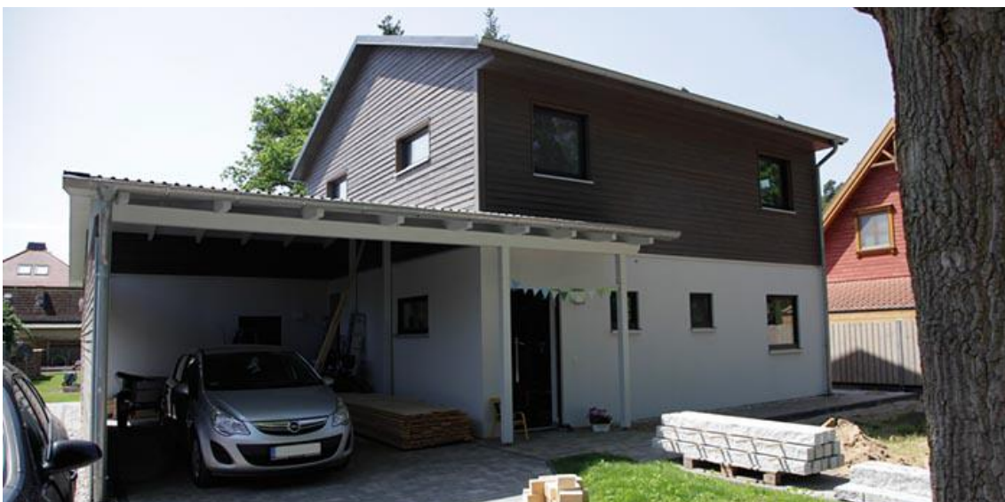
Eingangsbereich des Einfamilienhauses mit Carport