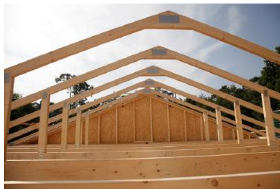
Schnelle Montage der Wand- und Deckenelemente vor Ort