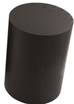
INHERMO Montagequader (links) und -zylinder (rechts)

Für die Aufnahme punktförmiger Lasten hat INHERMO außerdem den schwarzen INHERMO Montagezylinder im Programm. Er eignet sich für sichere Einzelbefestigungen wie z.B. von Vordächern, Klappladen-Scharnieren oder Wandleuchten in der INHERMO-gedämmten Fassade.