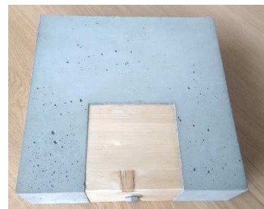
(Variante mit integr. Holzklötz)