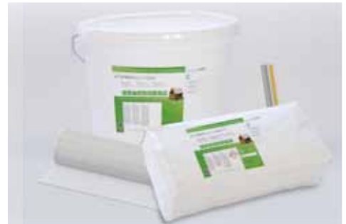
Bild 2: Das STEICO secure System bietet Gestaltungsfreiheit und Vielfalt aus einer Hand.