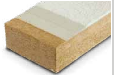
Bild 1: Die stabilen Dämmplatten vereinen in sich alle Vorteile des Naturproduktes Holz.