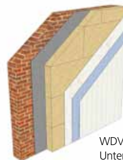
WDVS auf mineralischem Untergründen mit Holzrahmenkonstruktion