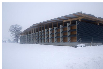
Depot, Museum, f. Kommunikation Prix Lignum 2015, Gold national