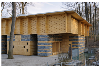
Bärenhaus Tierpark Dählhölzli, Bern Prix Lignum 2012, Gold National

Fühlen Sie sich angesprochen? Dann freuen wir uns, Sie kennen zu lernen!