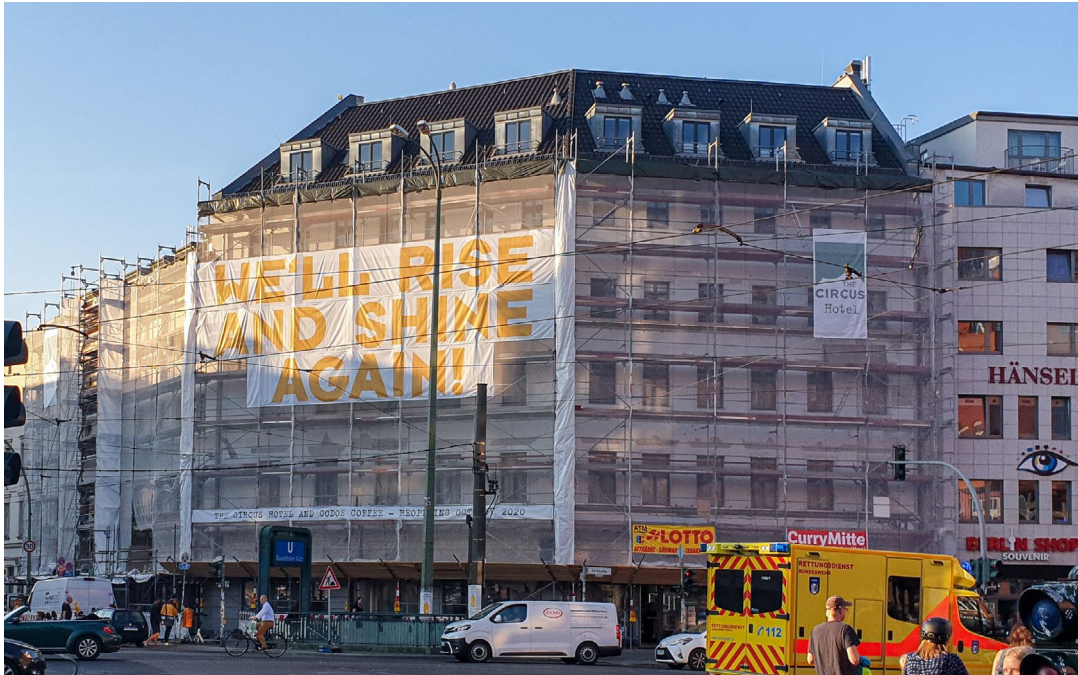
Das Hotel „The Circus“ in Berlin

Die Krise als Chance nutzen: Das haben sich die Betreiber des renommierten Hotels The Circus im Herzen Berlins vorgenommen und haben ihm ein komplett neues Gewand verliehen. Die insgesamt fünf Etagen wurden von Grund auf saniert und modernisiert. Alle Zimmer und Räumlichkeiten im Erdgeschoss wurden umgestaltet, ein neues gastronomisches Konzept umgesetzt und die Klima- und Heizungsanlage ausgetauscht. Gerade der letzte Punkt war eine große Herausforderung, denn der Zeitrahmen für die Sanierung war denkbar knapp gewählt: Beginn Anfang September 2020 – Wiedereröffnung am 01. Dezember 2020. Durch das flexible, schnell und einfach zu verarbeitende neue Kühl- und Heizsystem für die Decke von ArgillaTherm konnte die Installation bereits Ende Oktober abgeschlossen werden. Seitdem sorgen 700 Quadratmeter Natur-Klimadecken von ArgillaTherm für ein Wohlgefühl bei den Gästen.